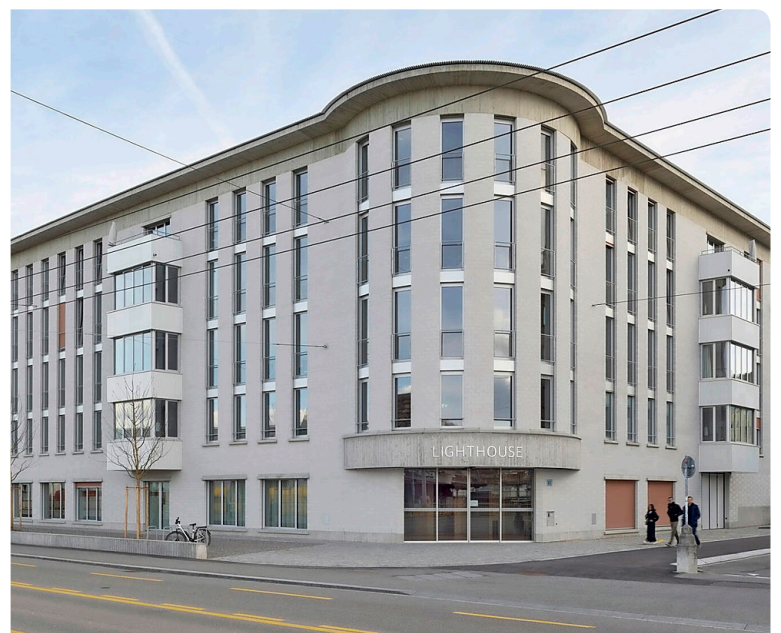
Der Neubau an der Eglistrasse im Kreis 4 bietet Patientinnen und Patienten Orte des Rückzugs wie eine Dachterrasse und einen Raum der Stille.